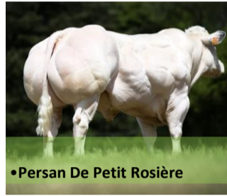
•Persan De Petit Rosière