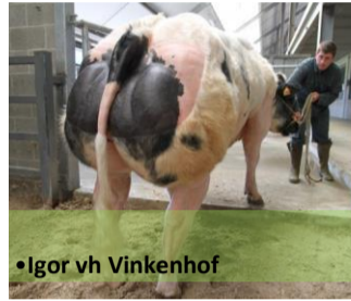
•Igor vh Vinkenhof