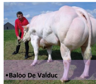
•Baloo De Valduc

Geboortegewicht <100 : de kalveren hebben een lager geboortegewicht.