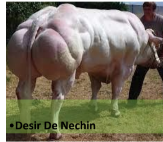
•Desir De Nechin