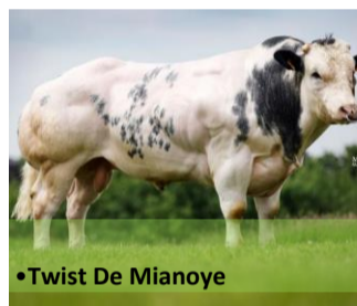
•Twist De Mianoye