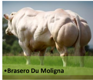
•Brasero Du Moligna