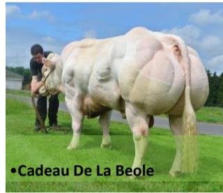
•Cadeau De La Beole