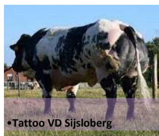
•Tattoo VD Sijloberg