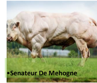
•Sénateur De Mehogne