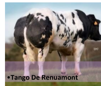
•Tango De Renuamont