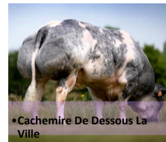
•Cachemire De Dessous La Ville