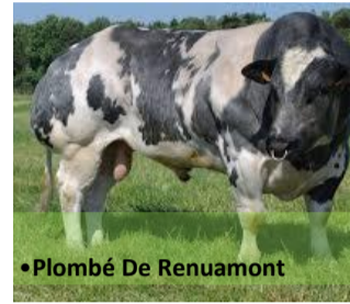
•Plombé De Renuamont