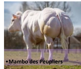
•Mambo des Peupliers