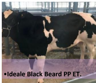
•Ideale Black Beard PP ET.