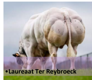
•Laureaat Ter Reybroeck