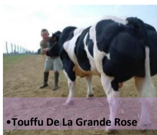
•Touffu De La Grande Rose