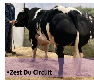
•Zest Du Circuit