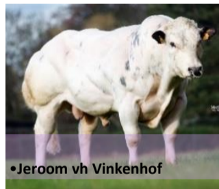
•Jeroom vh Vinkenhof