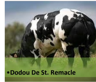
•Dodou De St. Remacle