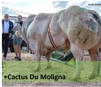
•Cactus Du Moligna