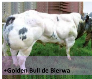
•Golden Bull de Bierwa