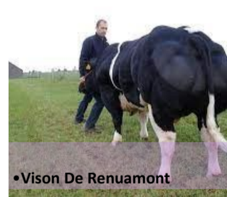
•Vison De Renuamont