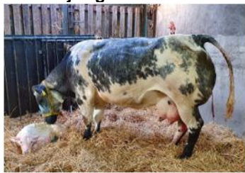
bbm 22,0 x 18,0 (72 mnd)

15-9-20 stierkalf, 51 kg, 286 dgn dd V Bob vd Plashoeve VW +0,72 +0,03 M (Adajio de Bray) FW +0,38 +0,60