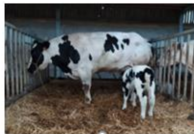
M 1693 van het Lindenveld FW H +0,23 B +0,59 (btbh 50 55)