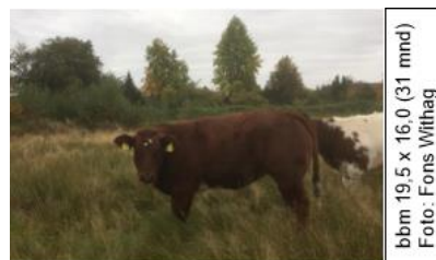
bbm 19,5 x 16,0 (31 mnd)

6-8-20 vaarskalf, zeer vlot geboren V Us Heit v Knedo FW +1,01 -0,16 M (Teunis 67 vKnedo) FW +0,31 -0,12