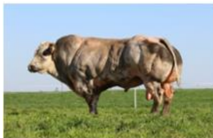
V Bandiet van het Lindenveld FW H +1,30 B +1,41 (btbh 65 69)