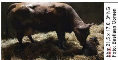
bbm 21,5 x 17,0, 3 e NG

11-3-20 vaarskalf, 35 kg, 272 dgn dd V Senco v Maris VW +0,03 +0,11 M (Palpitant de Croix-Dames)