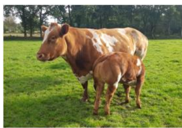
bbm 22,75 x 18,75, 4 e NG

15-9-20 stierkalf, 51 kg, 286 dgn dd V Bob vd Plashoeve VW +0,72 +0,03 M (Adajio de Bray) FW +0,38 +0,60