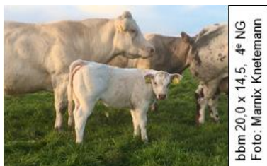
bbm 20,0 x 14,5, 4 e NG

20-2-20 kalf, 46 kg, supervlot geboren V Gertinus Volenbeek FW +0,62 +0,90 MV Dario v Pesaken FW +0,70 -0,01