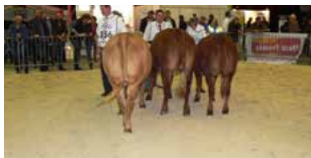
Rubriek 8 vrouwelijk 1-2 jaar