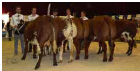
Rubriek 9 vrouwelijk 2-4 jaar