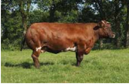
Bekkenhoogte 22.0 Bekkenbreedte 18.0