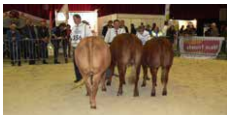
Rubriek 8 vrouwelijk 1-2 jaar