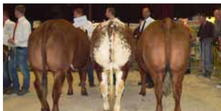
Rubriek 12 afstammelingen Stier, 5 Jacobar