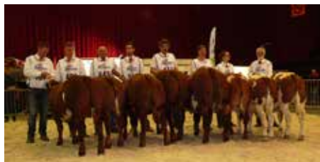
Rubriek 2 mannelijk 5-12 mnd