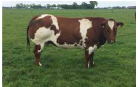
Bekkenhoogte 21.5 Bekkenbreedte 15.0