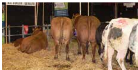
Bewust natuurlijk luxe