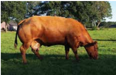
Bekkenhoogte 22.0 Bekkenbreedte 15.2

Bedrijven die nog niet eerder gemeten hebben en graag willen weten hoe het één en ander precies in zijn werk gaat, kunnen het filmpje "Bekkenmaten meten" op onze website www.verbeterd-roodbont-vleesvee.nl bekijken. Tevens vindt u op de site een nieuwe koppeling naar vleesvee-net en Bewust Natuurlijk Luxe. Hier vindt u nog meer informatie.