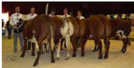
Rubriek 9 vrouwelijk 2-4 jaar