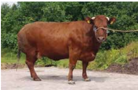
Bekkenhoogte 20.5 Bekkenbreedte 17.0