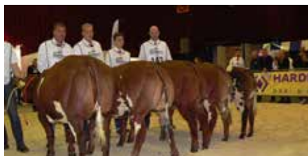
Rubriek 7 vrouwelijk 8-12 mnd