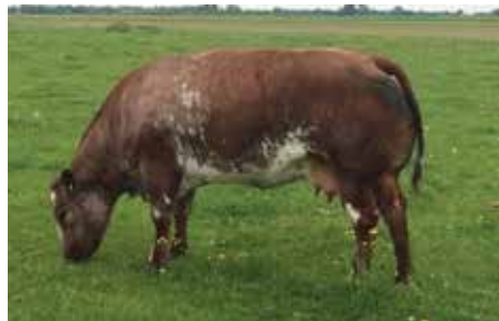
Bekkenhoogte 22.5 Bekkenbreedte 19.5

Aan de hand van eerdere metingen kunnen we hier een aantal koeien laten zien die ruim gemeten zijn en een schofthoogte hebben die richting het nieuwe fokdoel gaat en tóch het rastype hebben behouden.