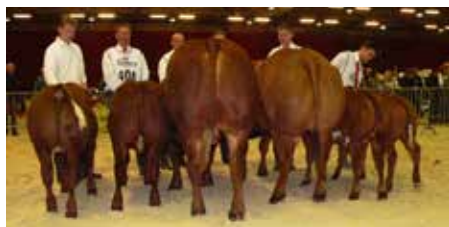
Alle kampioenen mannelijk en vrouwelijk