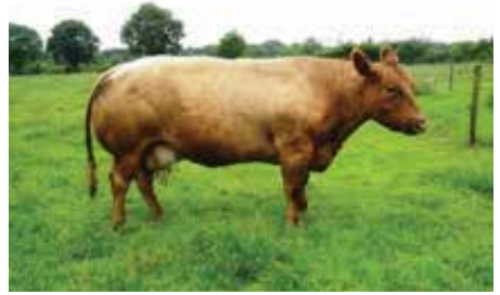
Bekkenhoogte 22.0 Bekkenbreedte 16.2

Bedrijven die nog niet eerder gemeten hebben en graag willen weten hoe het één en ander precies in zijn werk gaat, kunnen het filmpje "Bekkenmaten meten" op onze website www.verbeterd-roodbont-vleesvee.nl bekijken. Tevens vindt u op de site een nieuwe koppeling naar vleesvee-net en Bewust Natuurlijk Luxe. Hier vindt u nog meer informatie.