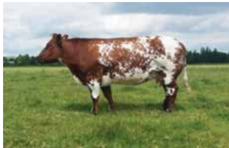
Bekkenhoogte 22.5 Bekkenbreedte 19.5