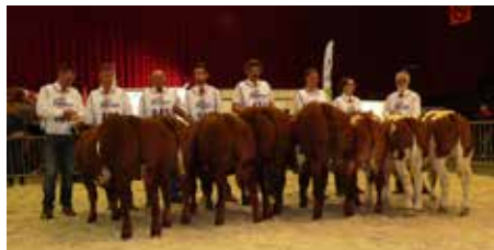
Rubriek 2 mannelijk 5-12 mnd