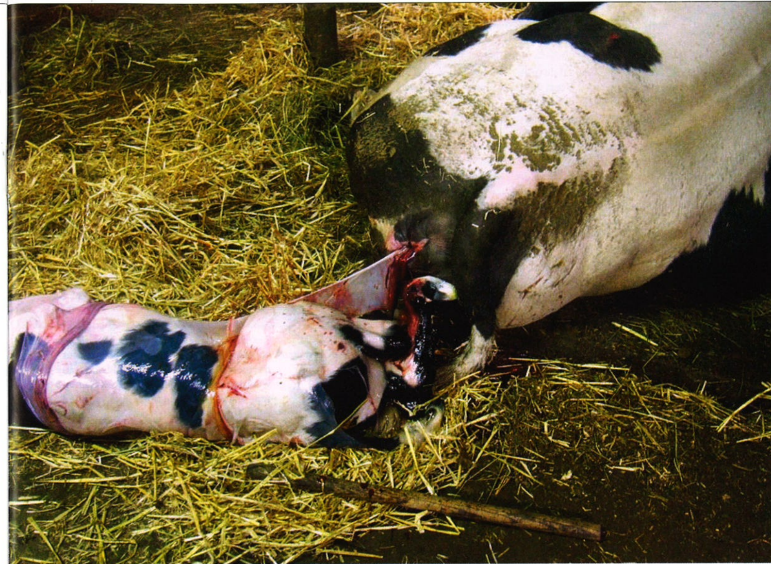
De interne bekkenhoogte van een koe is de belangrijkste maat voor een natuurlijke geboorte

ibh = interne bekkenhoogte, ibb = interne bekkenbreedte